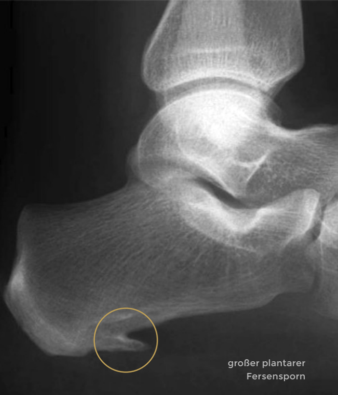
großer plantarer Fersensporn